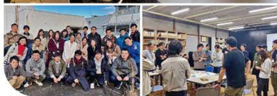
鳥取砂丘、中心市街地、鹿野城下町を舞台としたワークショッププログラムの様子